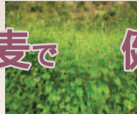
黄色いダツタンソバの花

生産組合事務局では「お茶以外には使えないかと思いましたが、プロの方の手に掛かると、八割・十割ソバがともおいしく色々な可能性があることが分かりました」と今後に期待しています。また、すいとん・そばがき・クレープ・ケーキなどの新製品も販売され好評です。