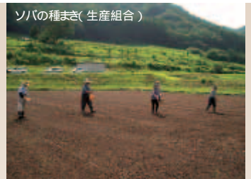
ソバの種まき(生産組合)

町のそば・ほうとう店では、地元産のダツタンソバを使った製品の販売を開始し、県内外の人気を呼んでいます。