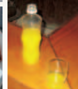
ソバ湯(町内そば店)